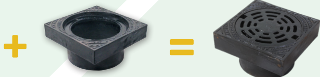
22212.334 Ø315 mm fast karm