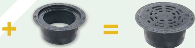
22212.234 Ø315 mm flydende karm