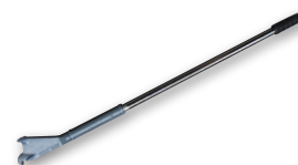
222219.900 Universal dækselnøgle